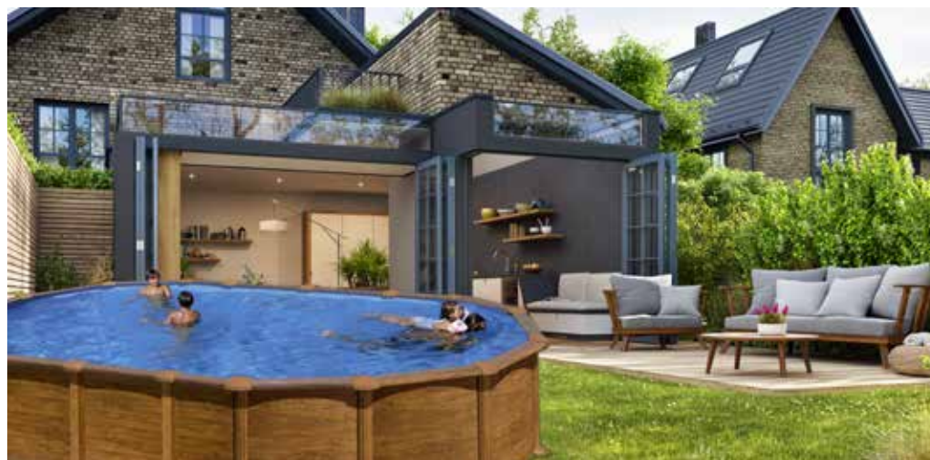
cod. KITPROV6188WO Ovale 610 x 375 x \pm 132 cm